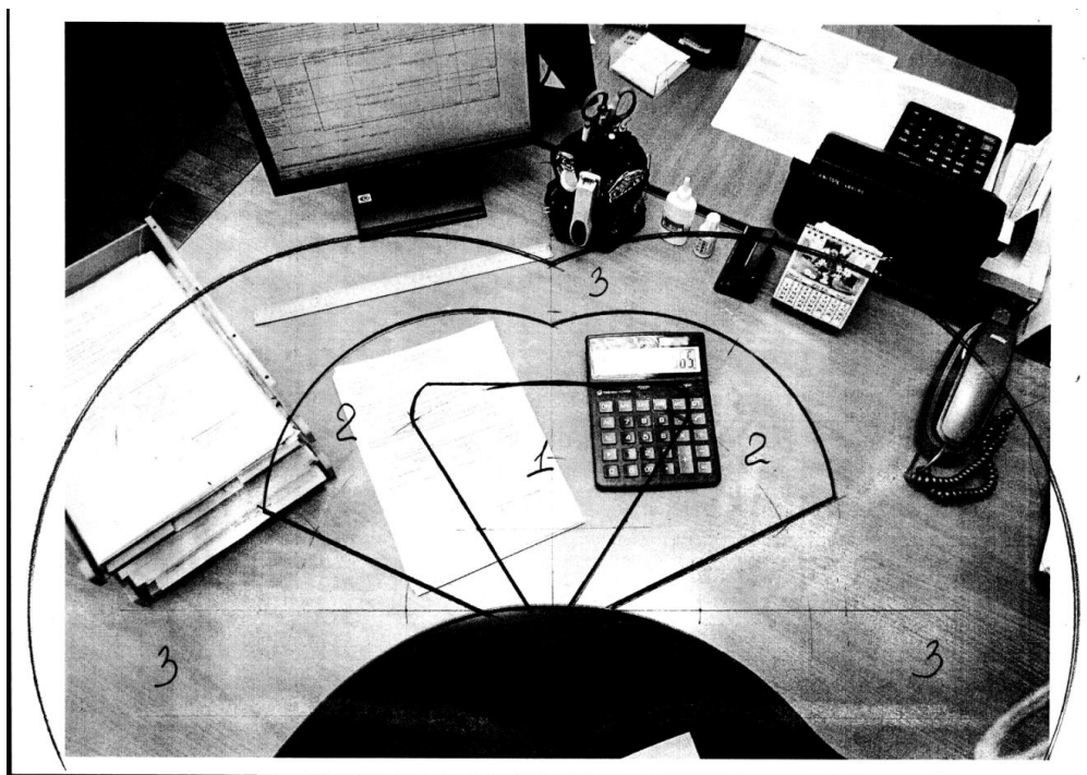
Рисунок 1 – Фотография рабочего места к заданию 13

14 Проанализировать фотографию рабочего места представленную на рисунке 2. Сделать выводы по рациональности размещения предметов на рабочем столе с учетом частоты их использования при работе специалиста экономической службы предприятия.