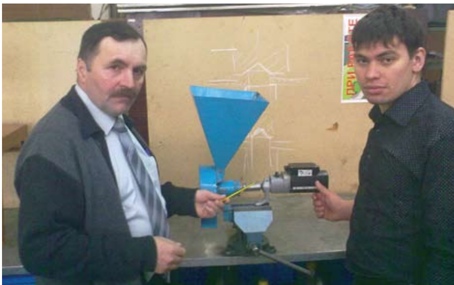
На фото: Дисковая мельница по измельчению зерна для личных подсобных хозяйств.

- Нужно отметить, что из года в год растет число участников конференции. В марте 2011 года в 39 секциях конференции приняло участие свыше 700 студентов из 11 вузов нашей страны. Интересные доклады представили студенты Вятской ГСХА, Чувашской ГСХА, Пензенской ГСХА, Казанско-