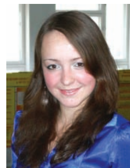
автор: Анастасия Барышева, студентка 1 курса экономического факультета

- Хочется сказать, что все преподаватели – достойные люди, хорошие профессионалы, но я бы выделил преподавателя моих любимых предметов – «Маркетинг»