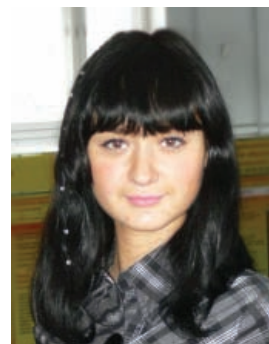
автор: Юлия Зыбина , студентка 4 курса зооинженерного факультета, член республиканского совета студентов и аспирантов